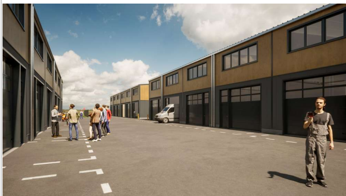
CUBE CAMPUS Campusweg