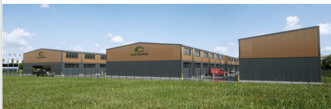
CUBE CAMPUS Gesamtansicht