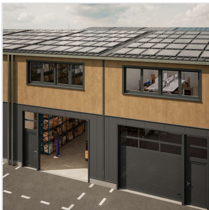
CUBE Obergeschoß Büro