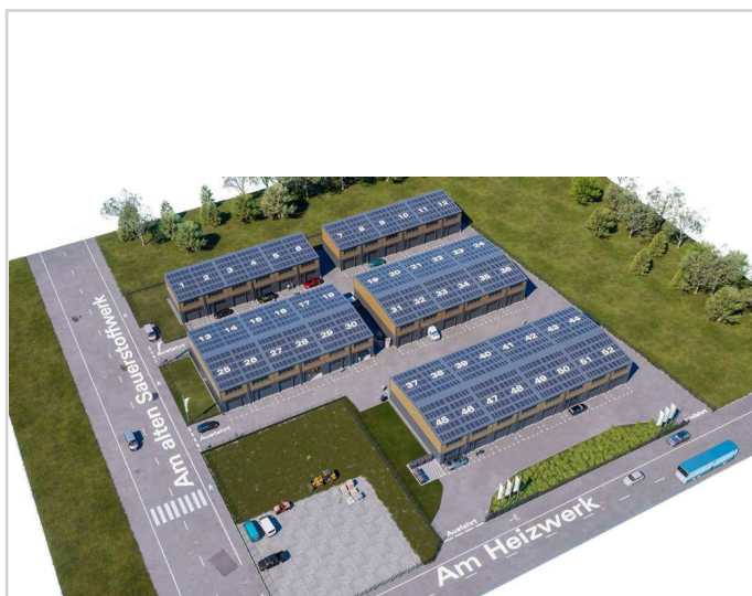
CUBE CAMPUS Lageplan 3D