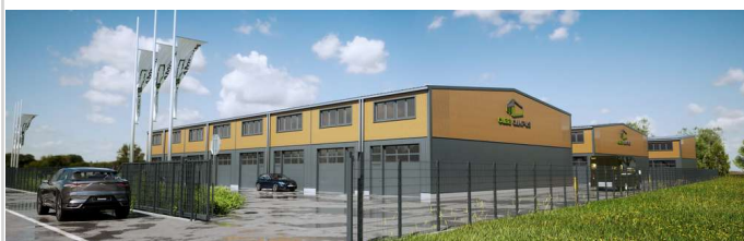
CUBE CAMPUS Einfahrt